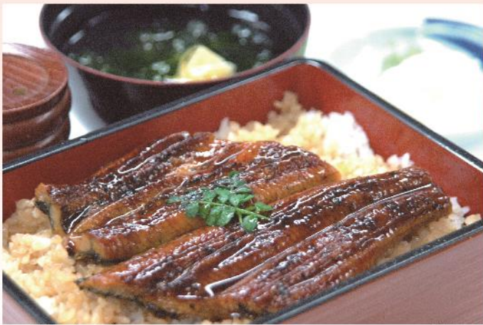
天然うな重 時価 天然うな重、御椀、香の物